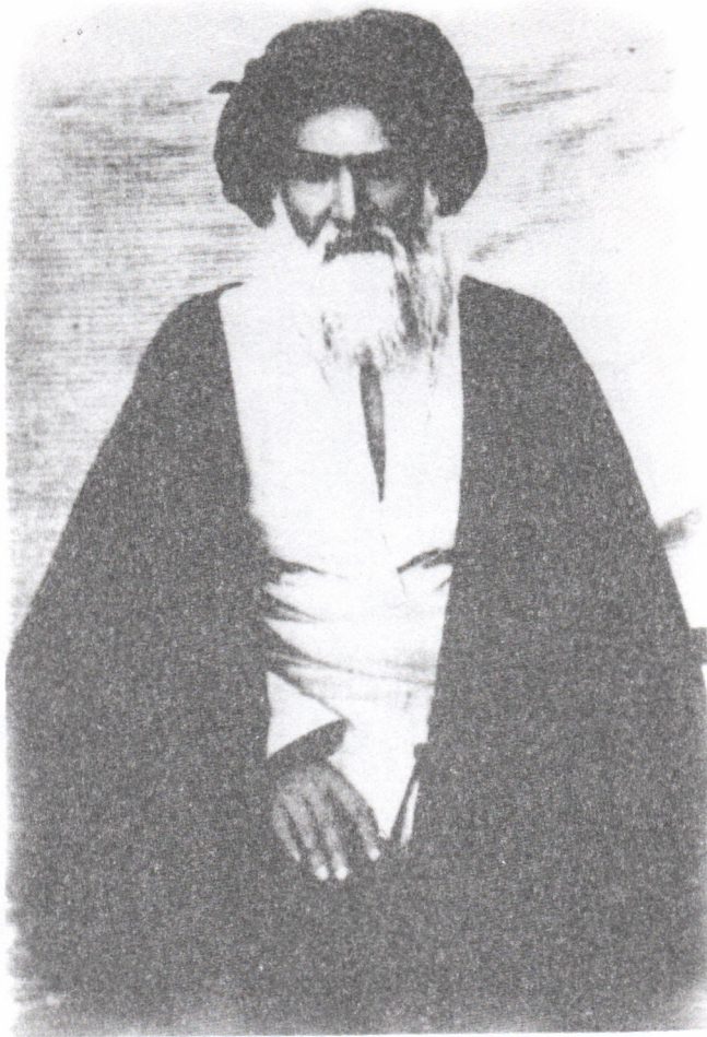
صورة أخرى آية الله العظمى السيد أبو الحسن الأصفهاني في مدينة قم المقدسة أثناء فترة إبعاده من قبل السلطات العراقية عام ١٣٤٢ هـ