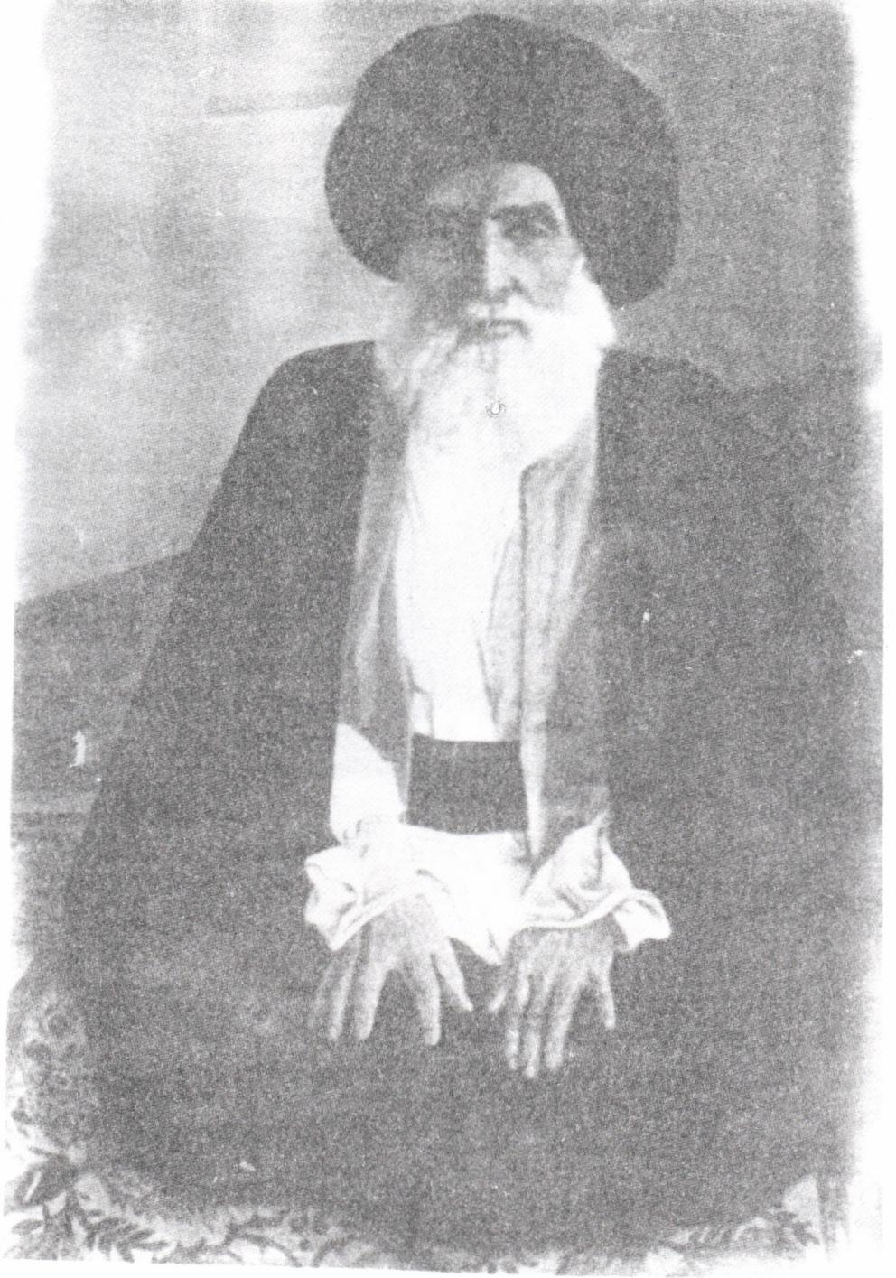
صورة تذكارية لآية الله العظمى السيد أبو الحسن الأصفهاني في أخريات أيام حياته الشريفة