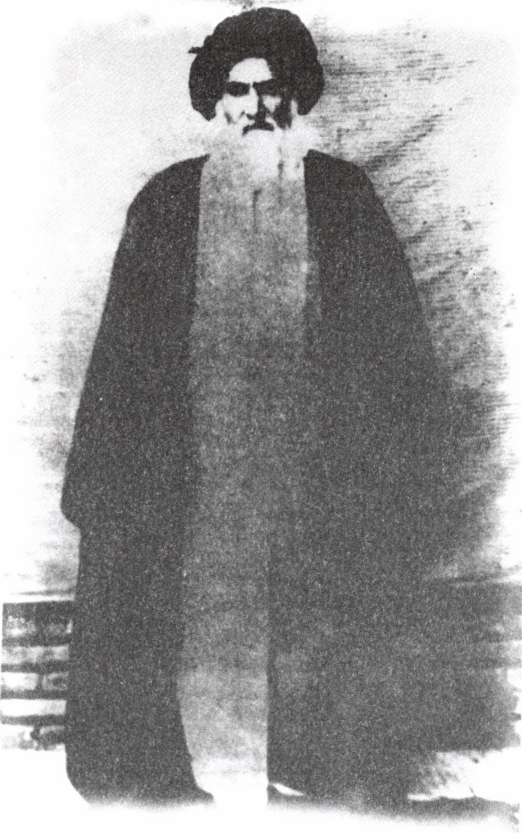
آية الله العظمى السيد أبو الحسن الأصفهاني (رض) في صورة تذكارية عام ١٣٤٢ هـ أثناء فترة إبعاده عن النجف الأشرف لمدة ١١ شهراً.