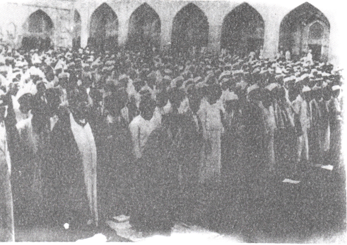
ثلاث صور مختلفة لإمامة السيد أبو الحسن الأصفهاني الصلاة في صحن الروضة الكاظمية المطهرة في بغداد، في أواخر أيام حياته الشريفة (القيام)